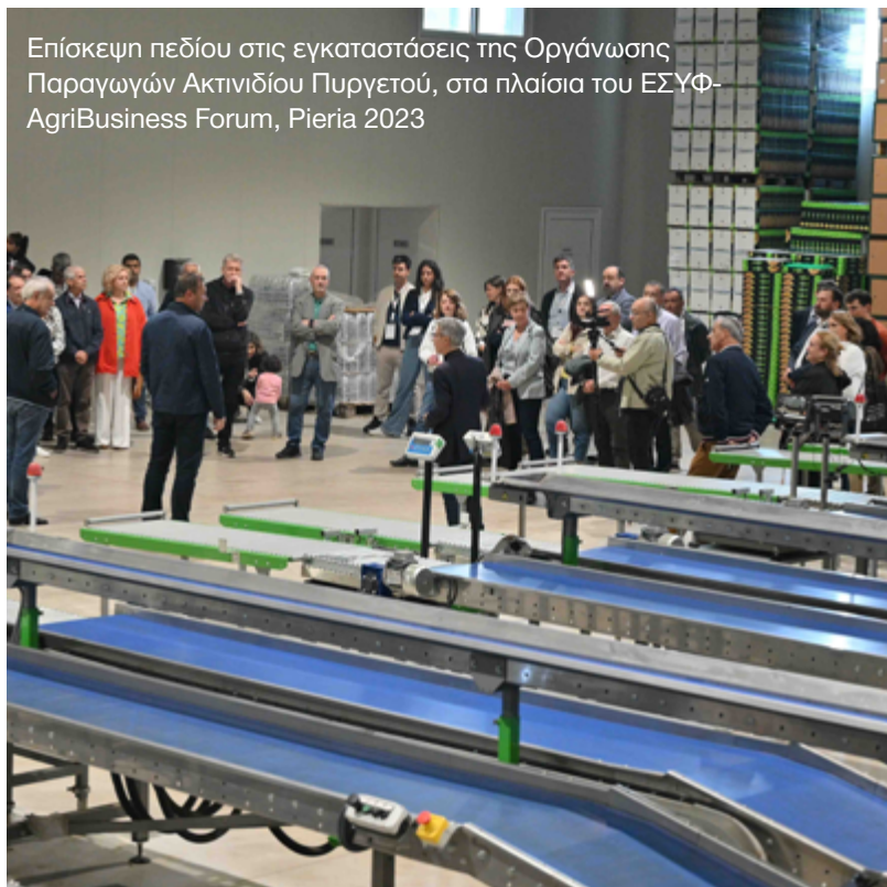
Επίσκεψη πεδίου στις εγκαταστάσεις της Οργάνωσης Παραγωγών Ακτινιδίου Πυργετού, στα πλαίσια του ΕΣΥΦ-AgriBusiness Forum, Pieria 2023